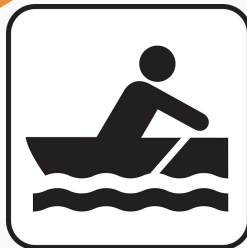
Kleinfahrzeuge ohne Maschine