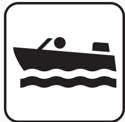
Kleinfahrzeuge mit Maschine